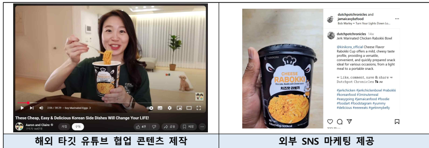
해외 타깃 유튜브 협업 콘텐츠 제작