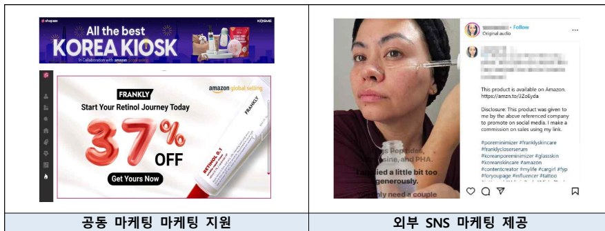
공동 마케팅 마케팅 지원